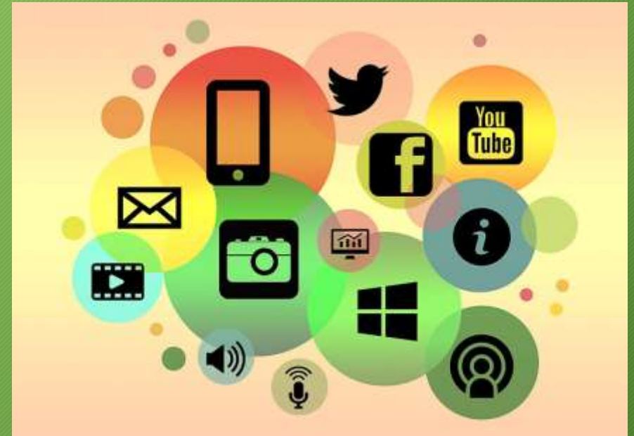
Communiceren over de statushouder