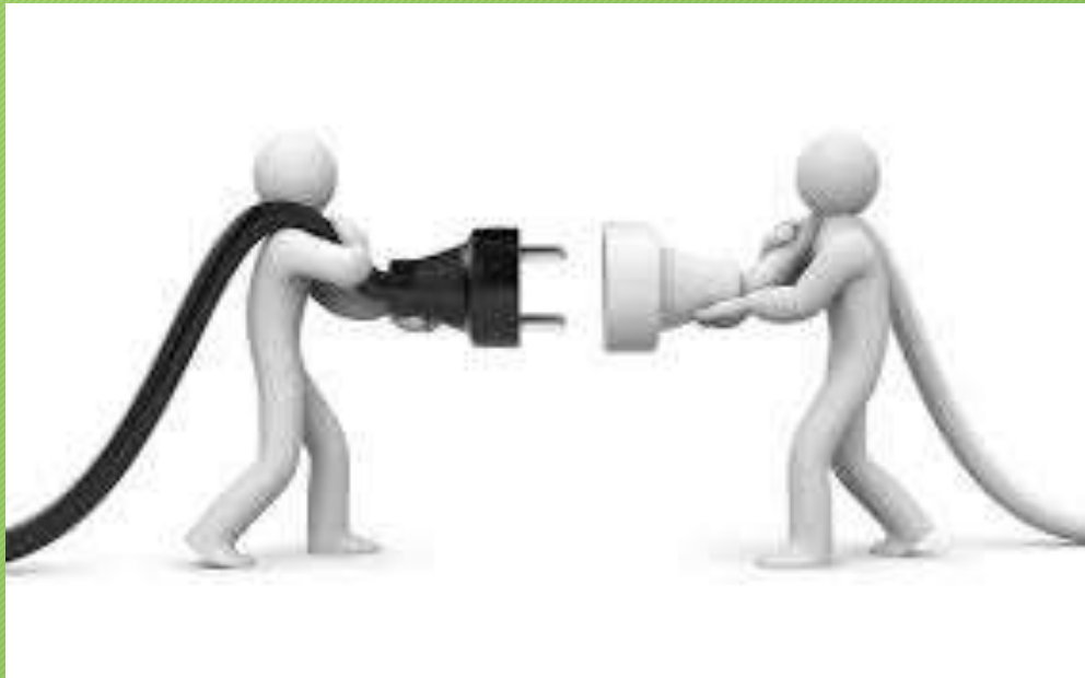
Communiceren met de statushouder