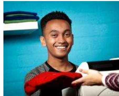
Verkoop en Retail