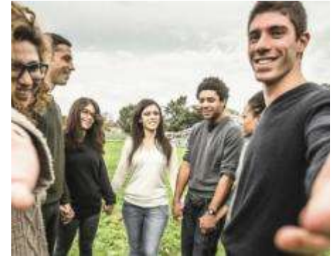
Dienstverlening en zorg