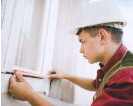
Bouwen en Wonen